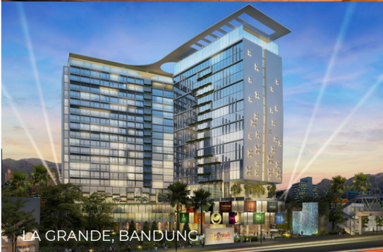
LA GRANDE, BANDUNG