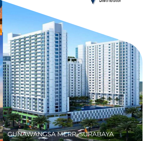
GUNAWANGSA MERR, SURABAYA