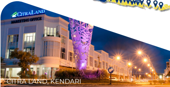
CITRA LAND, KENDARI